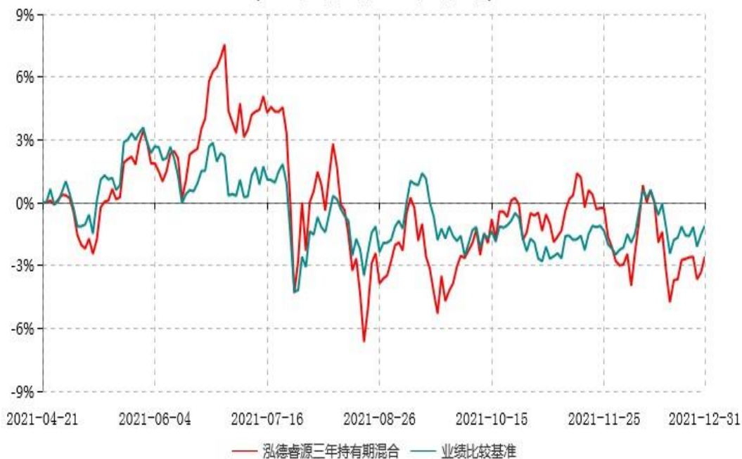
泓德睿源三年持有期灵活配置混合型证券投资基金累计净值增长率与业绩比较基准收益率历史走势对比图 (2021年04月21日-2021年12月31日)

注：1、本基金的基金合同于2021年4月21日生效，截至2021年12月31日止，本基金成立未满1年。 2、根据基金合同的约定，本基金建仓期为6个月，截至报告期末，本基金的各项投资比例符合基金合同关于投资范围及投资限制规定。